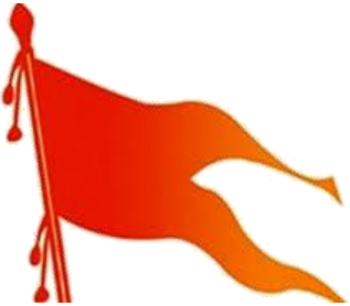
Bhagwa Dhvaj ભગવા ધ્વજ