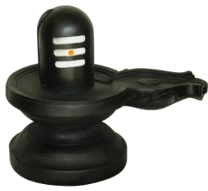
Shiv Ling શિવ લિંગ